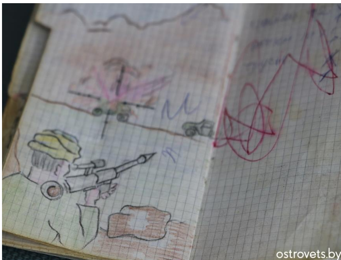
З Афгана ў падарунак будучай жонцы Алене прывёз дзве чарнільныя ручкі – яна доўга пісала імі.